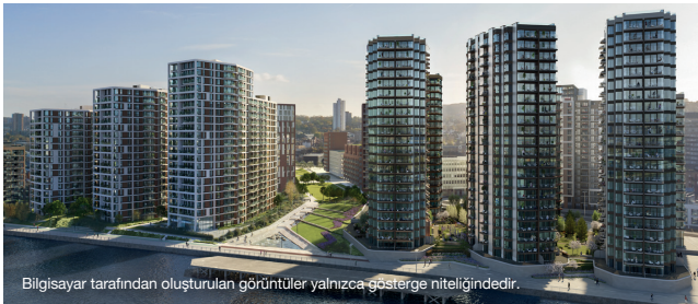
Bilgisayar tarafından oluşturulan görüntüler yalnızca gösterge niteliğindedir.

Londra'nın doğusunda, yaratıcılığın yeni merkezi Woolwich Works'in yakınında gelişen topluluk