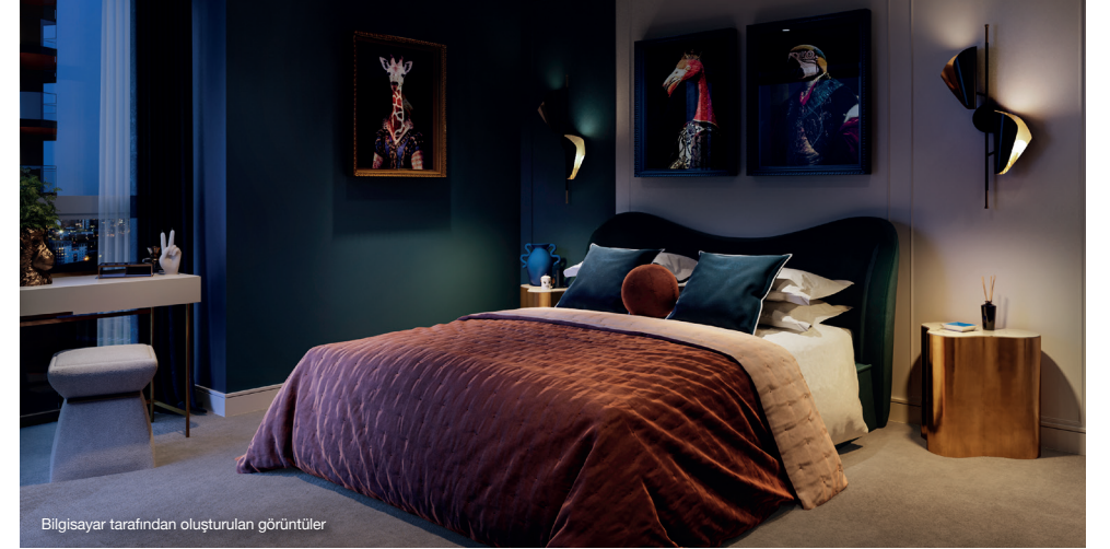
Bilgisayar tarafından oluşturulan görüntüler