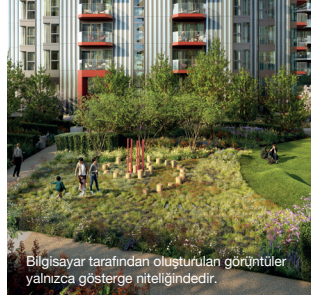
Bilgisayar tarafından oluşturulan görüntüler yalnızca gösterge niteliğindedir.