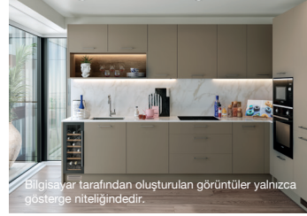
Bilgisayar tarafından oluşturulan görüntüler yalnızca gösterge niteliğindedir.