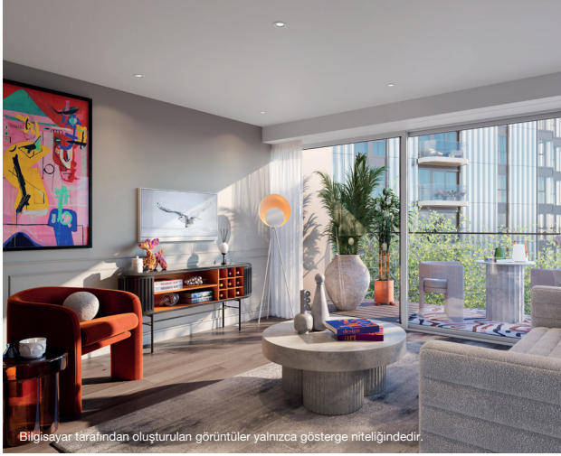
Bilgisayar tarafından oluşturulan görüntüler yalnızca gösterge niteliğindedir.