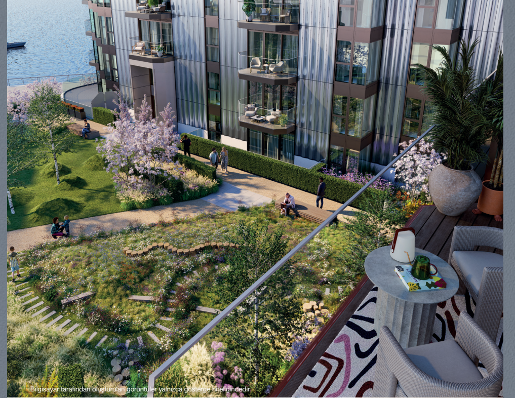
Bilgisayar tarafından oluşturulan görüntüler yalnızca gösterge niteliğindedir.