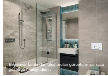
Bilgisayar tarafından oluşturulan görüntüler yalnızca gösterge niteliğindedir.