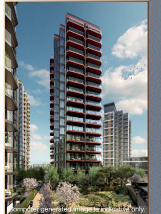
Computer generated image is indicative only.