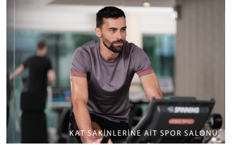
KAT SAKINLERİNE AIT SPOR SALONU