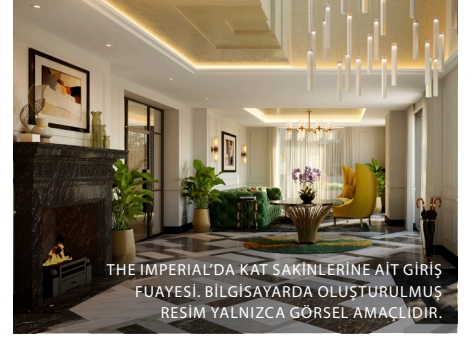
THE IMPERIAL'DA KAT SAKINLERİNE AIT GİRİŞ FUAYESİ, BİLGİSAYARDA OLUŞTURULMUŞ RESİM YALNIZCA GÖRSEL AMAÇLIDIR.