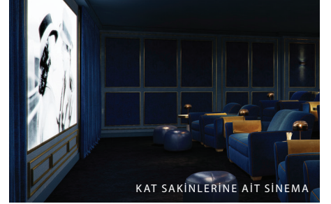
KAT SAKINLERİNE AIT SİNEMA