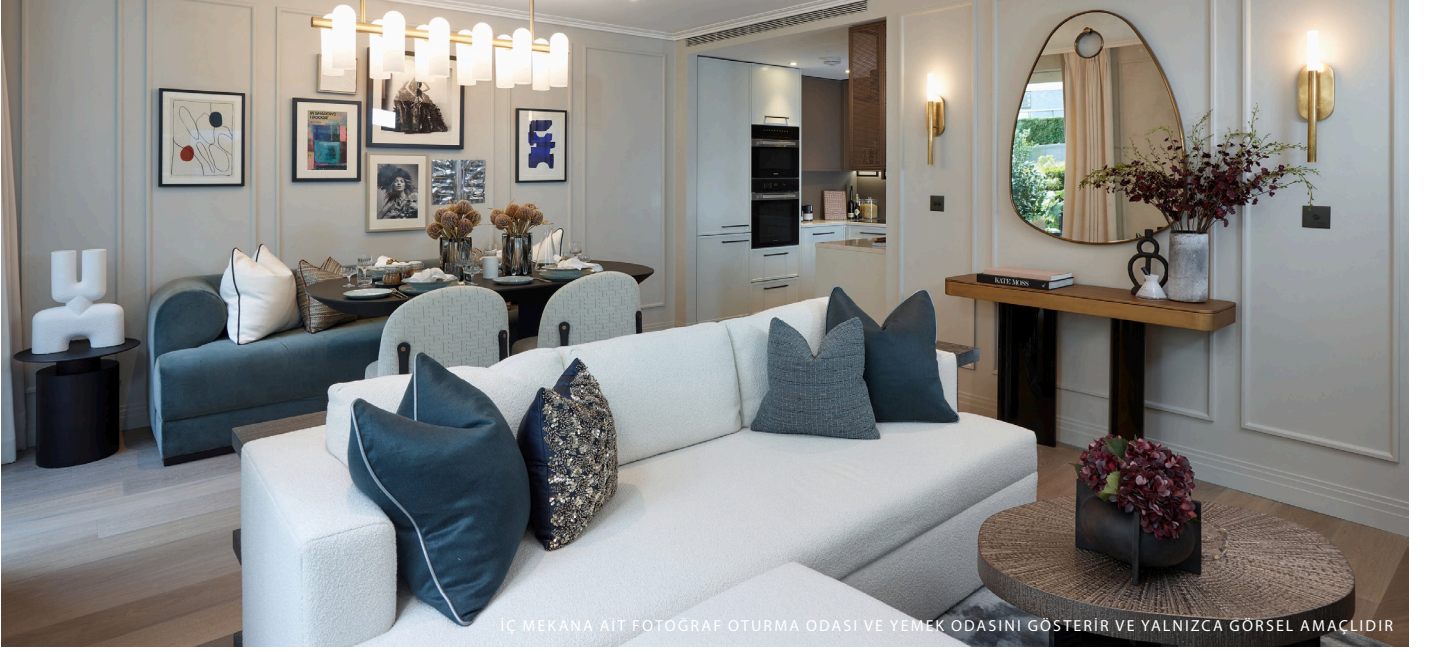
İÇ MEKANA AİT FOTOĞRAF OTURMA ODASI VE YEMEK ODASINI GÖSTERİR VE YALNIZCA GÖRSEL AMAÇLIDIR