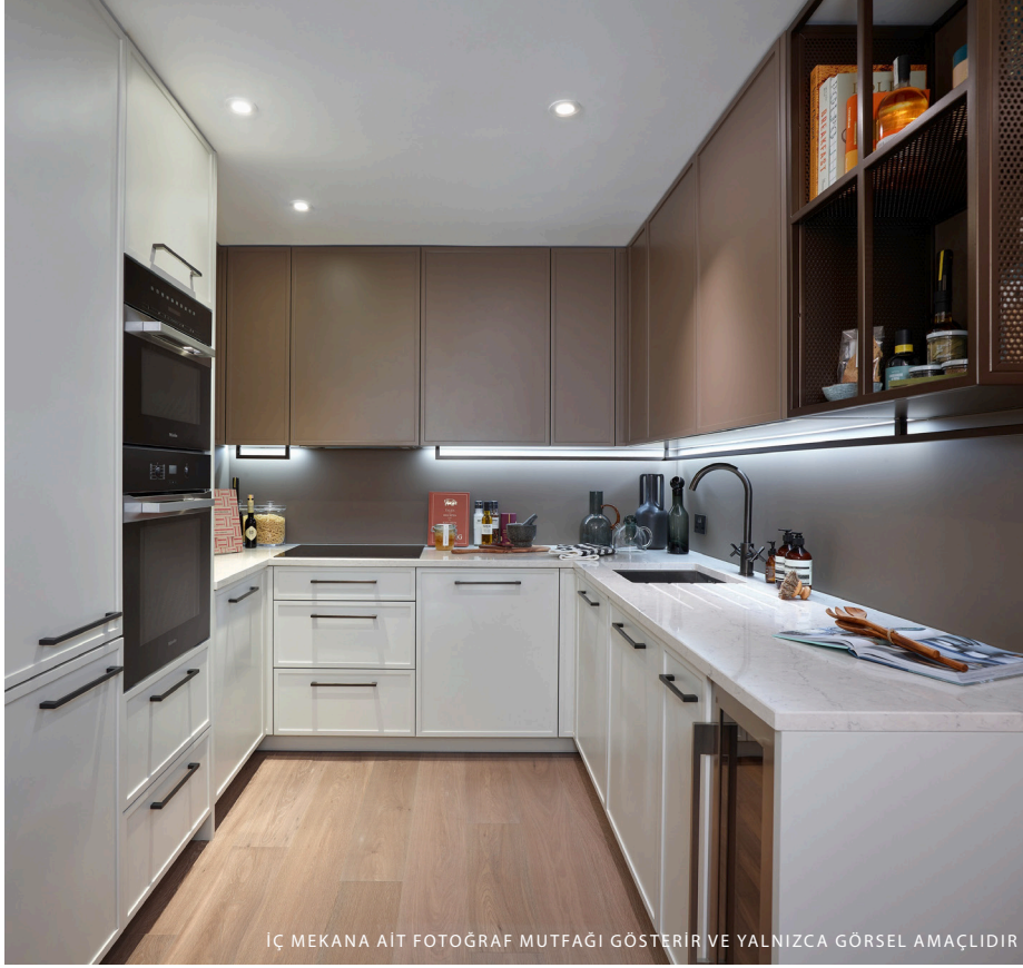
İÇ MEKANA AIT FOTOĞRAF MUTFAĞI GÖSTERİR VE YALNIZCA GÖRSEL AMAÇLIDIR