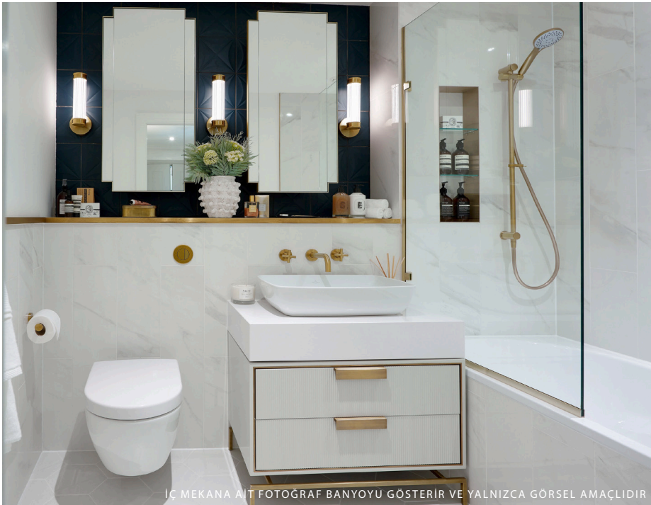
İÇ MEKANA AIT FOTOĞRAF BANYOYU GÖSTERİR VE YALNIZCA GÖRSEL AMAÇLIDIR

0,09 metrekare başına G1 – 7,46£; G2 – 7,63£; G3 – 7,35£