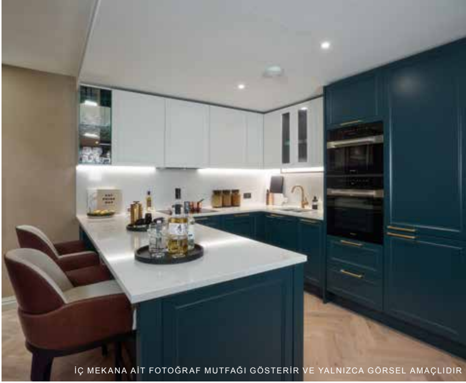
İÇ MEKANA AIT FOTOĞRAF MUTFAĞI GÖSTERİR VE YALNIZCA GÖRSEL AMAÇLIDIR