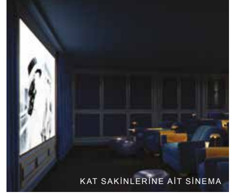
KAT SAKINLERİNE AIT SINEMA