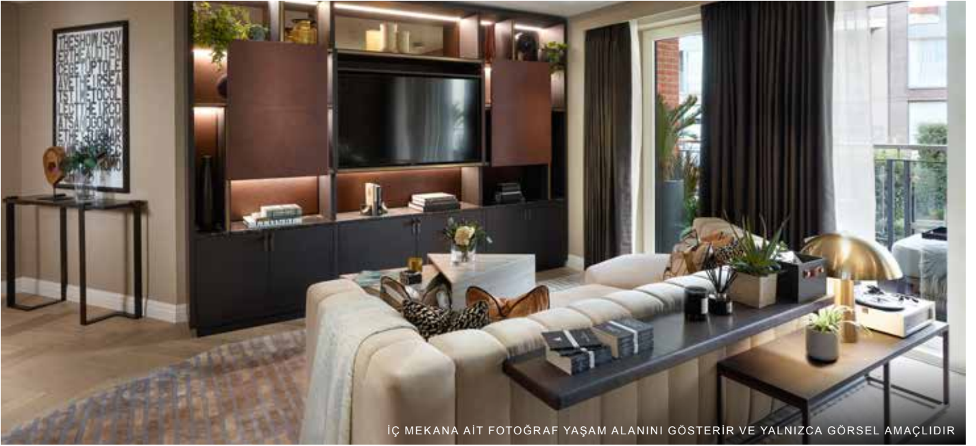
İÇ MEKANA AIT FOTOĞRAF YAŞAM ALANINI GÖSTERİR VE YALNIZCA GÖRSEL AMAÇLIDIR