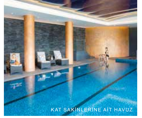
KAT SAKINLERİNE AIT HAVUZ