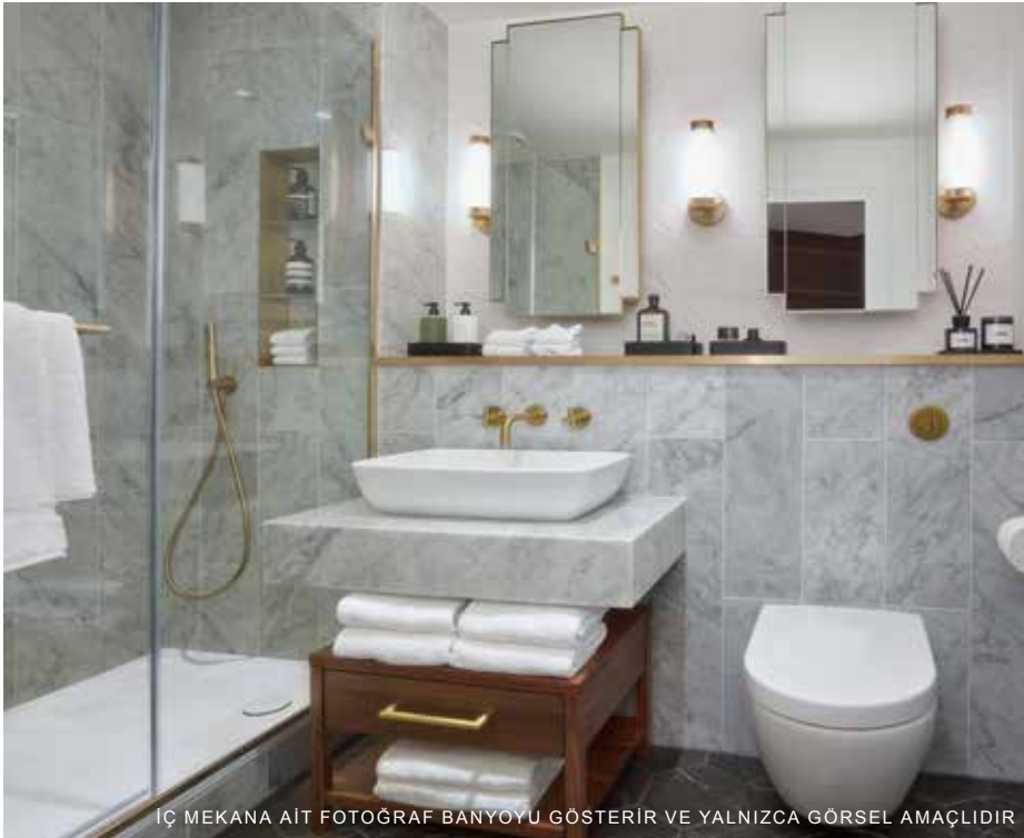
İÇ MEKANA AIT FOTOĞRAF BANYOYU GÖSTERİR VE YALNIZCA GÖRSEL AMAÇLIDIR

*Tahmini hizmet ücreti yalnızca itibari bir değerdir ve değişikliğe tabidir. İtibari değer 08/20 tarihlidir ve hazırlık aşamasından yasal tamamlama aşamasına kadar olan sürede ortaya çıkabilecek perakende fiyat endeksi, enflasyon v.b. artışları kapsamaz. Hizmet ücretini etkileyebilecek değişiklik koşulları, bunlarla sınırlı olmamak üzere, sektörde veya devlet kanunlarındaki değişiklikleri, beklenmeyen masrafları ve St George'un kontrolü altında olmayan diğer her türlü hususu içermektedir. Alanmış Yönetici Acente, ruhsatlar ve izinler, devren kiralama, yasal prosedürler ve yeniden satış/satış paketi dahil ancak bunlarla sınırlı olmayan öğeler için, hizmet ücretinin dışında ilave ücretler tahsil edebilir.